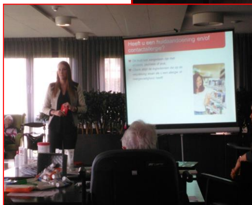
Er wordt aandachtig geluisterd