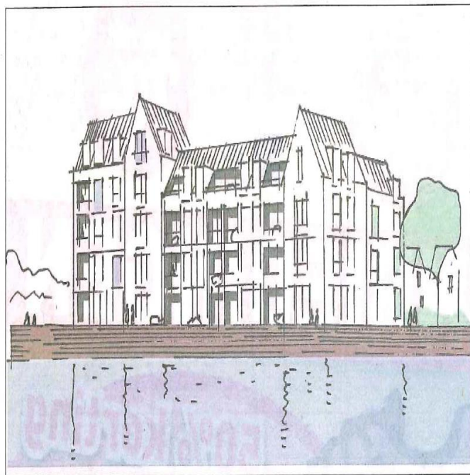
▲ Hoe Het Hoge Veer aan De Donge eruit zou kunnen zien - Artist Impression Oomen Architecten.

hebben en is ter ondersteuning voor wijkbewoners opdat zij zo lang mogelijk zelfstandig kunnen blijven wonen." Als alles volgens planning loopt, is het nieuwe Hoge Veer-complex eind 2018 klaar. Dan is er zowel een vestiging in Geertruidenberg als in Raamsdonksveer. "Ook de locatie Hoge Veer Rivierzicht blijven we exploiteren." Naast het zorgcomplex is ruimte voor zestig woningen, in overleg met grondeigenaar WSG kijkt men hoe dat gedeelte van de locatie verder ingevuld kan worden.